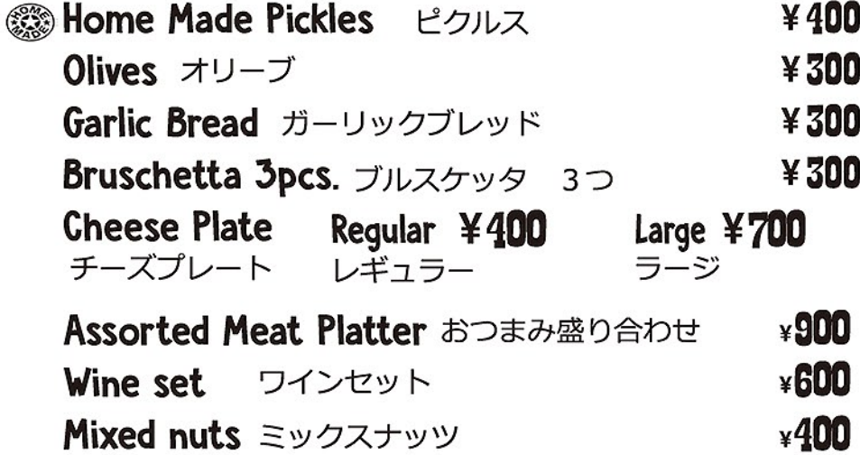
Assorted meat platter おつまみ盛り合わせ