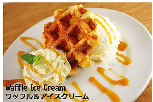
Waffle Ice Cream ワッフル&アイスクリーム