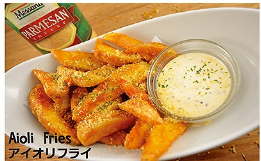
Aioli Fries アイオリフライ